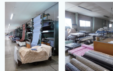
播州織工業協同組合さま

播州織は、兵庫県西脇市周辺で作られる先染め織物です。糸を染めた後に織るため格子模様が代表的ですが、複雑な模様を織ることもできます。