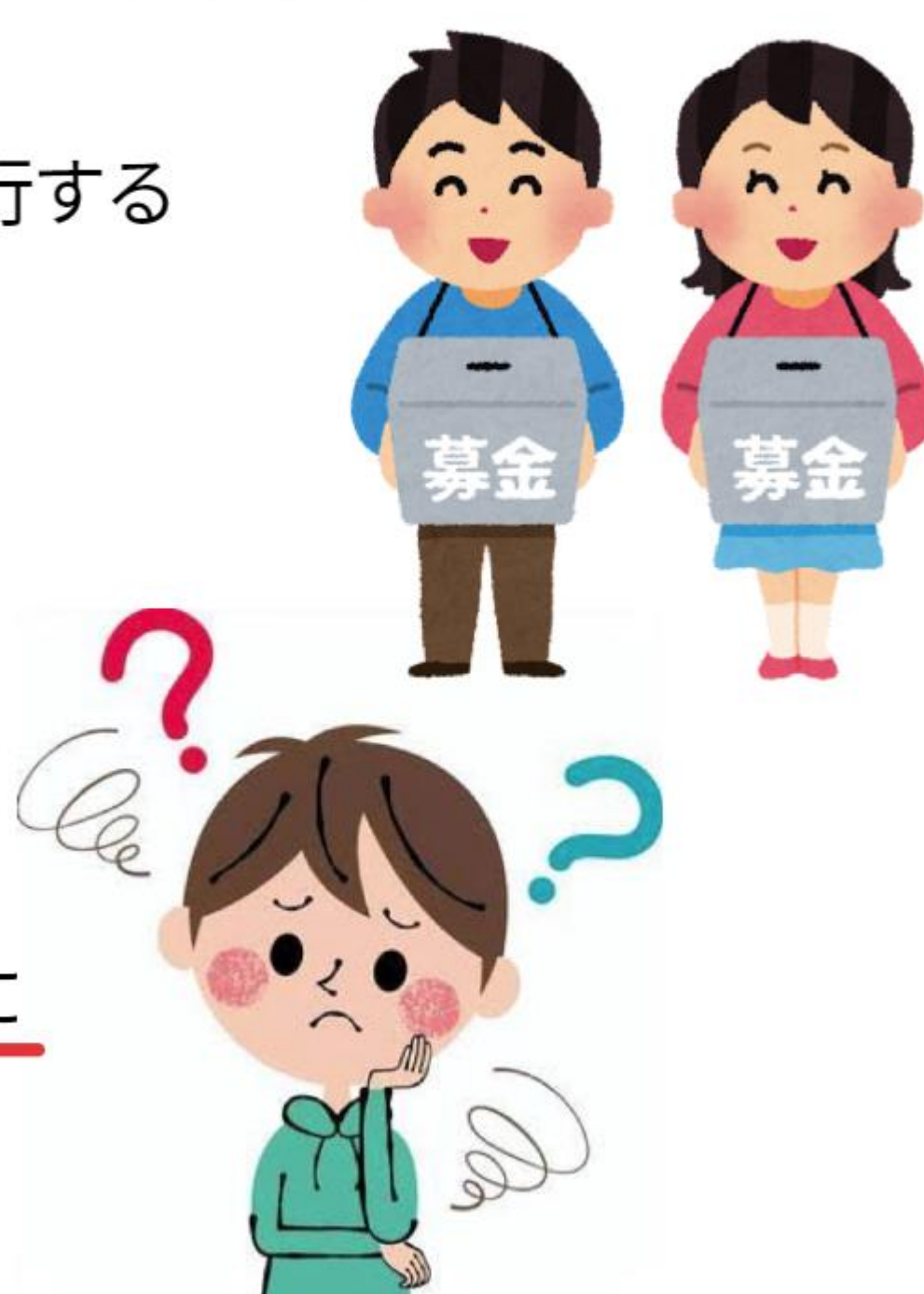
アンケートではいと答えた28人の意見です。

→今後、 都会と田舎での差別がない ように自分たちにもできることはないか考える →どのようにすれば改善できるのかを考え テレビやネット を見てもっと詳しく調べて考えを深める